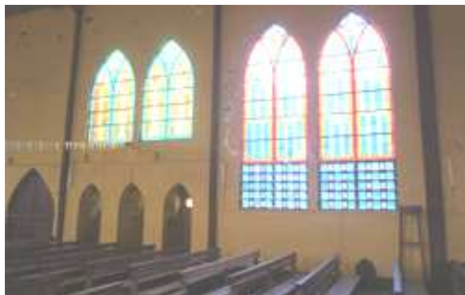
Foto: vista lateral de l'interior de la Catedral de Kenge.