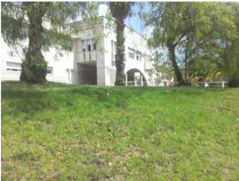
Foto: Residència de Sant Josep. Passeig Valle Hebron, 147 - 157.